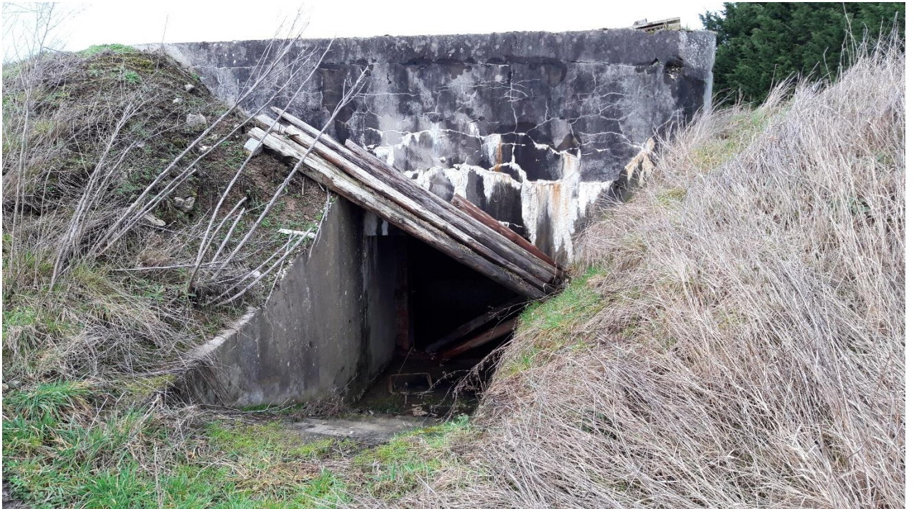
Blockhaus M117B KOEHL (blockhaus pour arme infanterie)