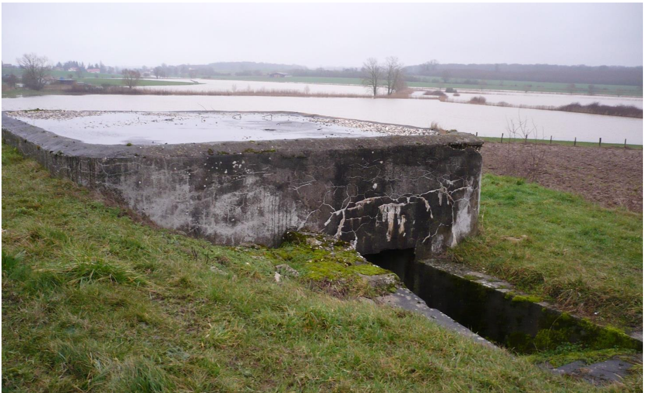
Blockhaus M118B ALBERG (blockhaus pour canon)