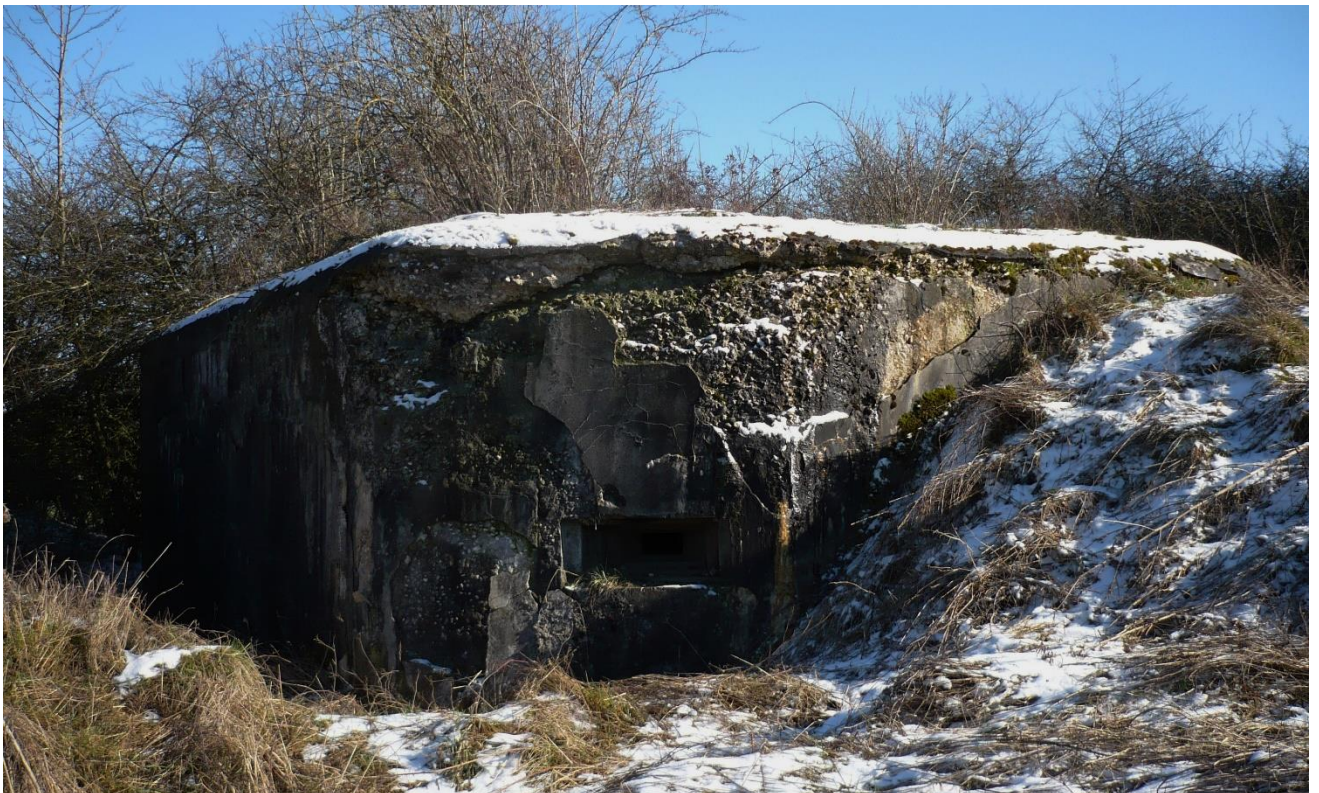
Blockhaus M116 BEIMATT